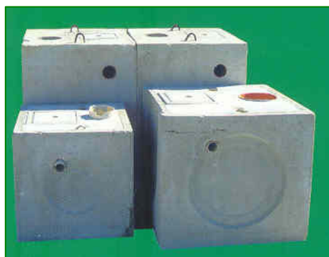
Plinto illuminazione di varie misure