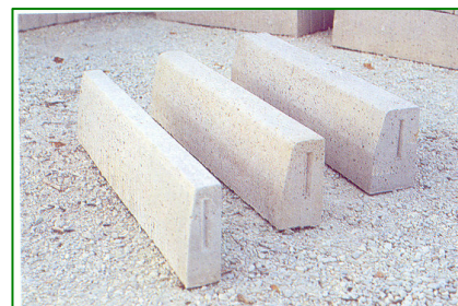
Foto cordoli stradali 6/8-10/12-12/15