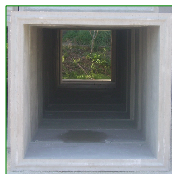
Foto prolunga pozzetto autoportante