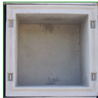
Foto pozzetto autoportante